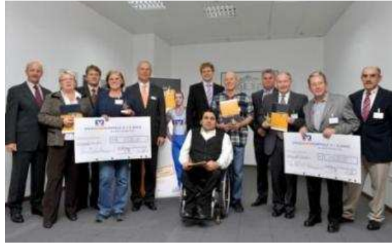
Preisträger u. Jury (u.a. St.Zyprian)